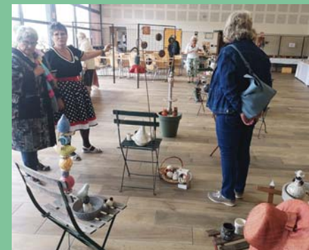
Juin : marché des Potiers.