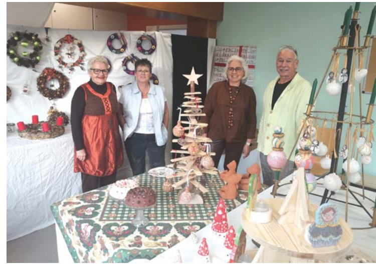
L'exposition de la section poterie.