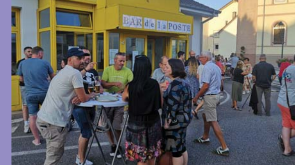
Août : ouverture du bar éphémère.