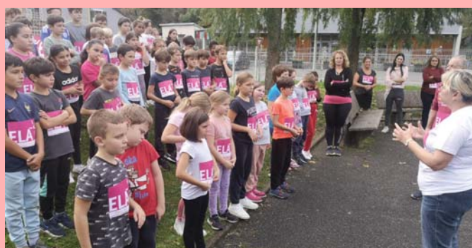
Octobre : course ELA à l'école élémentaire.