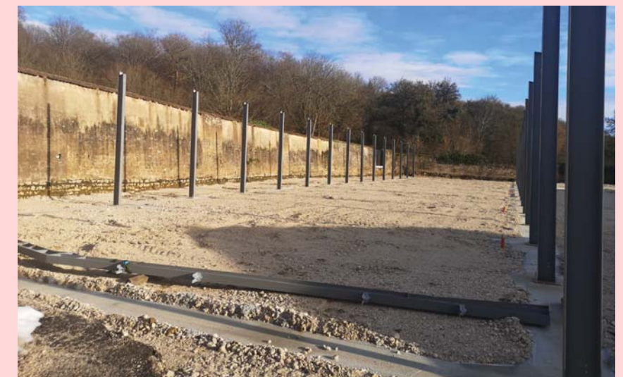
Les travaux de construction ont débuté fin novembre.

surface d'environ 4.000 m 2 .» Le reste de la nouvelle construction, soit 1.000 m 2 , sera divisé en six cellules qui seront disponibles à la location pour d'autres entreprises.