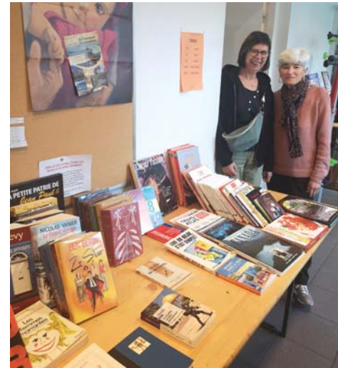
La Bibliothèque a fait de la place dans ses rayons !

Enfin, comme elle le fait régulièrement, la Bibliothèque a profité du passage du public pour proposer quelque 500 livres à des prix imbattables. L'objectif était de faire de la place dans les rayons afin de pouvoir continuer à présenter les dernières nouveautés littéraires.