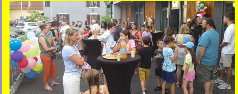
Juin : anniversaire du périscolaire.