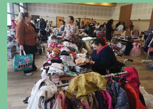
Octobre : bourse bébé.