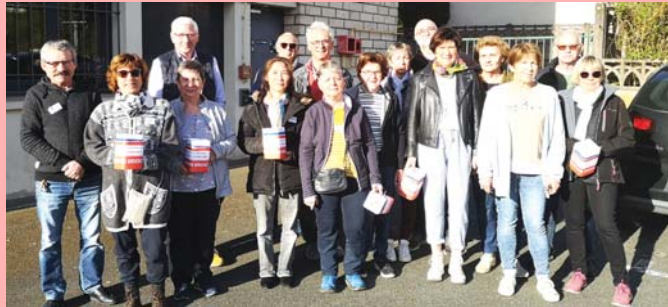
Avril : opération Brioches.