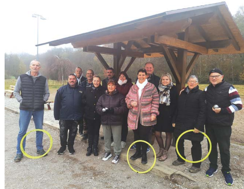
Les adhérents ont notamment rénové le auvent de leurs installations.

Dans le courant de l'automne, les membres du club de pétanque de Dampierre ont effectué un gros travail sur leurs installations du site du Parcours. Ils ont complètement rénové leur auvent, remplaçant notamment la toiture, et ils ont construit eux-mêmes de jolis bancs disposés en bordure du terrain. A noter que la commune a participé à cette opération en prenant en charge le coût des matériaux nécessaires. Au printemps dernier, les membres du club avaient déjà redonné un coup de jeune à leur terrain en faisant disparaître les mauvaises herbes et en remettant le sol à niveau. Même si nous sommes désormais dans une saison pas forcément compatible avec les belles parties de pétanque, les installations devraient retrouver de l'animation aux beaux jours avec la quarantaine d'adhérents de l'association.