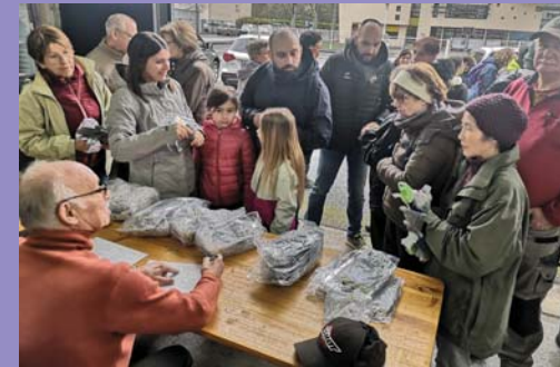
Mars : nettoyage de printemps.