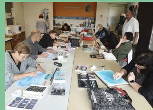
Juin : stage de pastel.