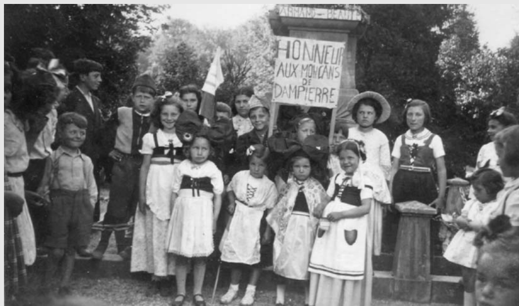
L'hommage de la population dampierroise au groupe de résistants.

Géographiquement, Dampierre ne représentait pas un intérêt stratégique, ni par sa situation, ni par ses voies de communication et son aspect de village