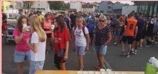
Août : course contre Charcot.