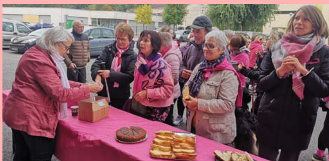
Octobre : marche pour Octobre rose.