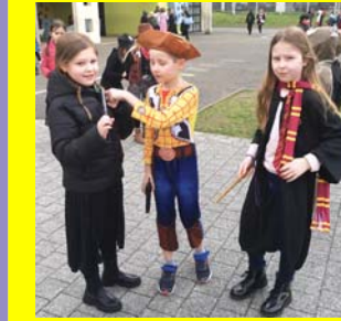
Mars : carnaval à l'école élémentaire.