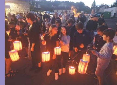
Juillet : soirée feux d'artifice.