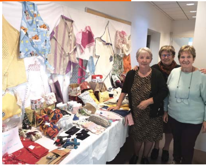
Les dames de la section couture.