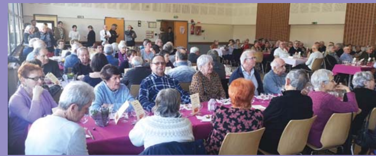
Janvier : repas des Anciens.