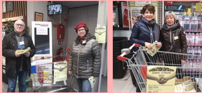
Février : opération Entraide.