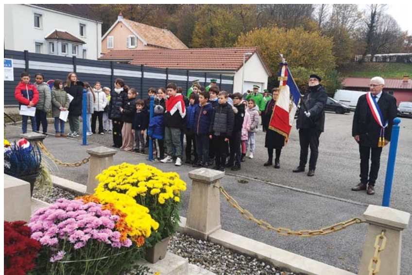
Le moment de recueillement devant le monument aux Morts.

Ils n'ont fort heureusement pas connu la guerre, mais ils cultivent le devoir de mémoire. De nombreux enfants ont pris une part active dans la commémoration du 11 novembre au cimetière, puis au monument aux Morts, en compagnie de la Municipalité, des anciens combattants, des musiciens de la Batterie-Fanfare, mais également de nombreux parents.