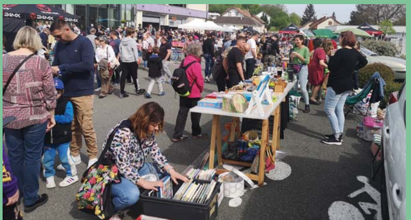
Mai : brocante du Comité des Fêtes.