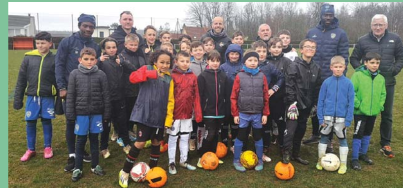
Mars : les mercredis du foot avec deux pros du FCSM à Dampierre.