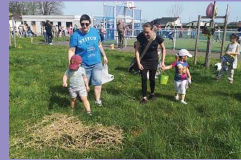
Avril : chasse aux œufs.