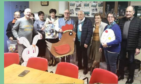
Février : le Comité des Fêtes prépare les animations.