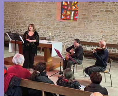
Avril : grande musique au Temple.