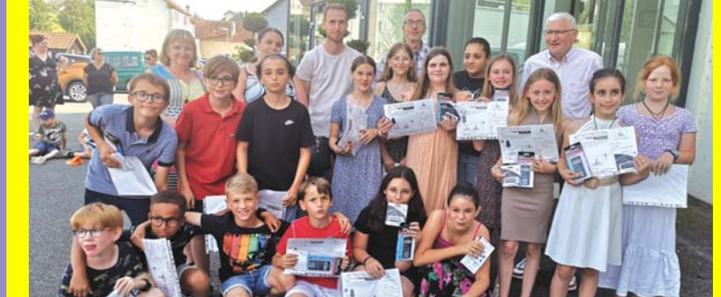
Juin : remise des calculatrices aux élèves de CM2.